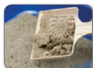
Gorotzak (katuak, txakurrak...) Excrementos (gatos, perros...)