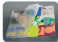
Paper plastifikatua Papel plastificado