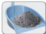
Xurgagailuak jasotako hondarrak Restos aspirados o barridos