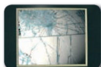
Ispilu eta leihoetako kristalak Cristales de espejos y ventanas