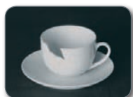
Zeramika eta portzelana Cerámica y porcelana