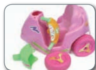
Jostailu hautsiak Juguetes rotos

Año 2016 urtea Gastoa tonako / Gasto por tonelada 173,12 €