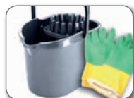
Pertzak eta gomazko eskularruak Cubos y guantes de goma