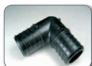
Plastikozko tutuak Tubos de plástico