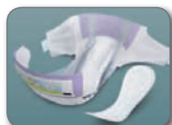
Pixoihalak eta konpresak Pañales y compresas