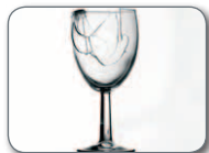
Kristalezko baxera Vajilla de cristal