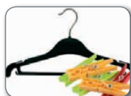
Pertxak eta pintzak Perchas y pinzas